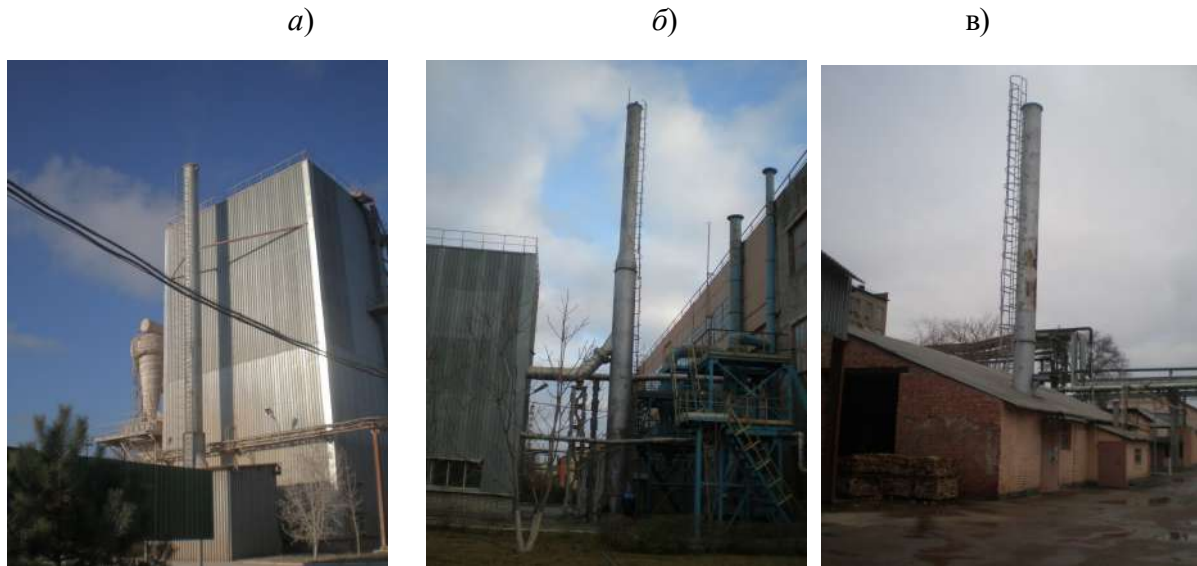
Рис. 2. Общій вид металлических дымовых труб мартеновского цеха: дымовой трубы высотой 25.00м газоочистки печи КС-55 – (а); дымовая труба высотой 24.00м газоочистки сушильного барабана ШОС – (б), дымовая труба высотой 17.80м печи обжига огнеупоров – (в).

Металлическая дымовая труба высотой 24.00м газоочистки сушильного барабана участка ШОС мартеновского цеха построена в 70-тые годы XX столетия. Высота трубы – 3.5м, диаметр выходного отверстия – 0.784м (рис.2, б). Ствол трубы с отм. 0.50м до отм.13.00м и отм. 14.00м и до отм. 24.00м цилиндрического очертания, внутренний диаметр трубы соответственно - 1084мм и 784мм, толщина стенки - 8мм. На отм. 7.50м к стволу трубы подходит газоход. Ствол трубы изготовлен из стали ВСтЗпс. Футеровка ствола трубы по всей высоте не предусмотрена. Под металлическую дымовую трубу устроен монолитный железобетонный фундамент, размером - 2.00x2.00м. класс бетона фундамента по проекту – В 15 (марка М200). Грунт в основании фундамента – суглинок. Металлическая труба закреплена на железобетонном фундаменте 4-ью анкерными болтами диаметром 42мм. Температура отводимых газов +100 0 С. Степень агрессивного воздействия – среднеагрессивная.