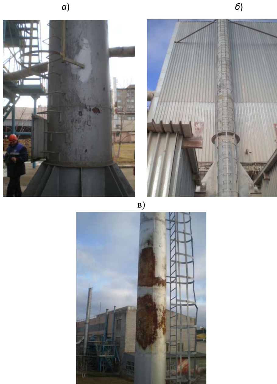
Рис. 3. Коррозия ствола трубы и разрушение защитного лакокрасочного покрытия: дымовой трубы газоочистки печи КС-55 – (а); дымовая труба газоочистки сушильного барабана ШОС – (б), дымовая труба печи обжига огнеупоров – (в).

Проверочные расчеты на устойчивость показали, что устойчивость металлических труб как стержневых элементов и как цилиндрических оболочек обеспечена.