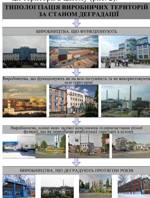
Рис. 2. Типи виробничих територій за станом деградації

Таким чином, проаналізувавши реальний стан деградованих виробничих територій в структурі великого міста, на прикладі м. Суми, можна зробити висновки, що існуюча проблема потребує науково-обґрунтованих рішень щодо відновлення деградованих територій, зокрема, виробничих.