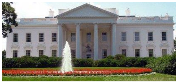
Рис. 3. Білий Дім, США.

Чорноминський палац здавна нарекли «Білим Домом», завдяки північному фасаду, що нагадує знамениту резиденцію американських президентів (рис.3,4). Звичайно відмінності є: півкруглий ризаліт американського палацу має шість колон, а чорноминського – вісім; вікон, по обидва боки від ризаліта, у першій будівлі відповідно – по чотири, а у другій – по три. У чорноминського палацу також немає балюстради вздовж даху.