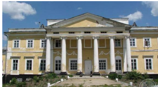
Рис.4. Палац у селі Чорномин

При всій зовнішній схожості двох видатних споруд сьогодні і досі немає жодного доказу, що Боффо надихався саме Білим Домом.