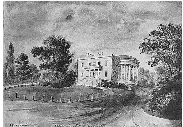
Рис. 1. Малюнок Наполеона Орди, 1871 рік. Вид на палац з боку під'їзду

був добудований, зведені муровані господарські будівлі (кухня, водокачка) та сторожка, що збереглася [1].